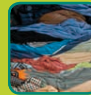
textiel aanleveren in zakken