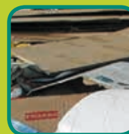
papier en karton dozen leegmaken en open vouwen