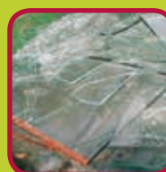
vlak glas 0,10 euro/kg