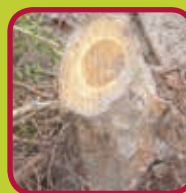
boomstronken 0,10 euro/kg zonder aarde