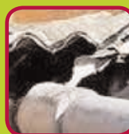
hechtgebonden asbest 200 kg/jaar/gezin: gratis >200 kg/jaar/gezin: 0,24 euro/kg verpakt in doorzichtig plastic bouwfolie van min. 0,10 mm dikte