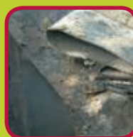
roofing 0,15 euro/kg