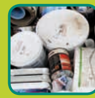
Klein Gevaarlijk Afval (KGA) verplicht melden aan de recyclageparkwachter