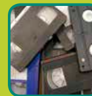
videobanden en muziekcassettes