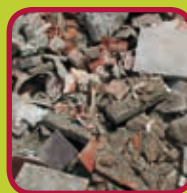
steen- en betonpuin 0,02 euro/kg