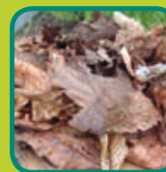
bladeren en boomvruchten zoals kastanjes, noten en eikels (geen fruit)