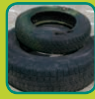
autobanden maximum 4 stuks per aanlevering