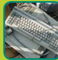
AEEA Afgedankte Elektrische en Elektronische Apparaten