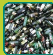
glazen flessen en bokalen ontdaan van etensresten