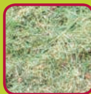
gras 0,10 euro/kg