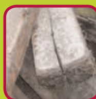
C-hout 0,15 euro/kg geïmpregneerd hout of behandeld met carboline