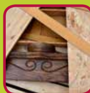
A-hout 0,10 euro/kg zuiver massier hout