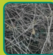
snoeihout takken van loofbomen en naaldbomen, struiken en coniferen houtige takken met een min. dikte van 1 cm en max. diameter van 20 cm