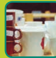
herbruikbare goederen ook fietsen en fietsonderdelen