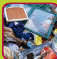
grof vuil 0,24 euro/kg