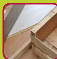
B-hout 0,10 euro/kg gelijmd of samengesteld hout