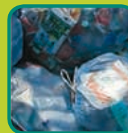
PMD verplicht aanleveren in blauwe PMD-zak