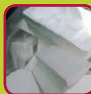
piepschuim <60 l: gratis 60 - 200 l: 1 euro >200 l: 6,50 euro wit en zuiver