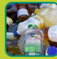
frituuroliën en -vetten