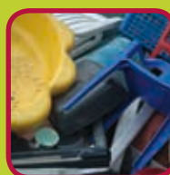
harde kunststoffen 0,10 euro/kg